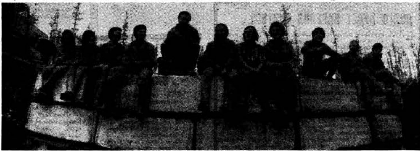
ОТРЯД ЛЕНИНГРАДЦЕВ РАБОТАЕТ НА СТРОИТЕЛЬСТВЕ МОСТА ЧЕРЕЗ ЛЕНУ.