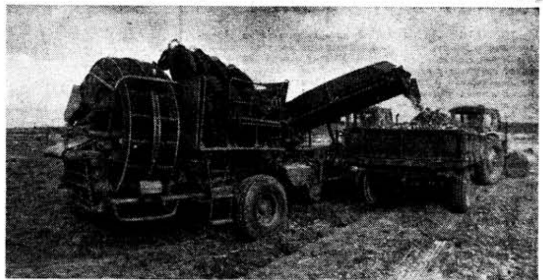
фото-летопись третьего семестра